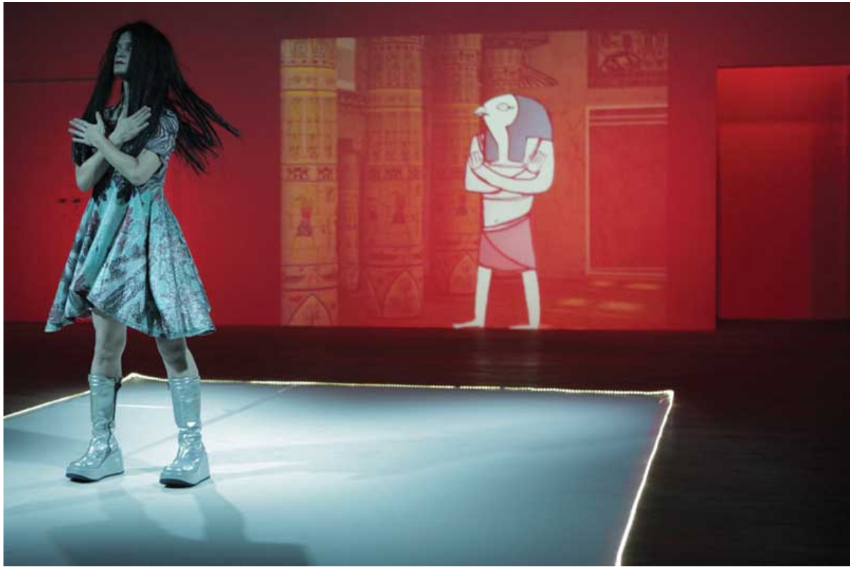
Karaoke Grill. Mov[i]Ment #3. Festival Grec (2012).