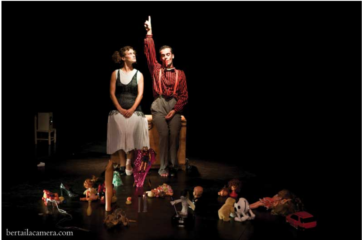
Los Moñecos. Residencia (2012)