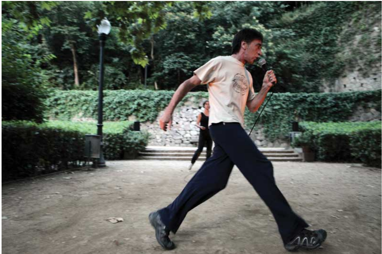
Projecte BCN_Montreal. Cal·ligrames en moviment. Itinerari dansat per Barcelona en col·laboració amb el Festival Grec (2013)