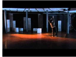
La incorruptible belleza de la distancia (promo)