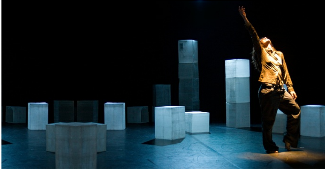
La incorruptible belleza de la distancia, 2012. Cecilia Colacrai