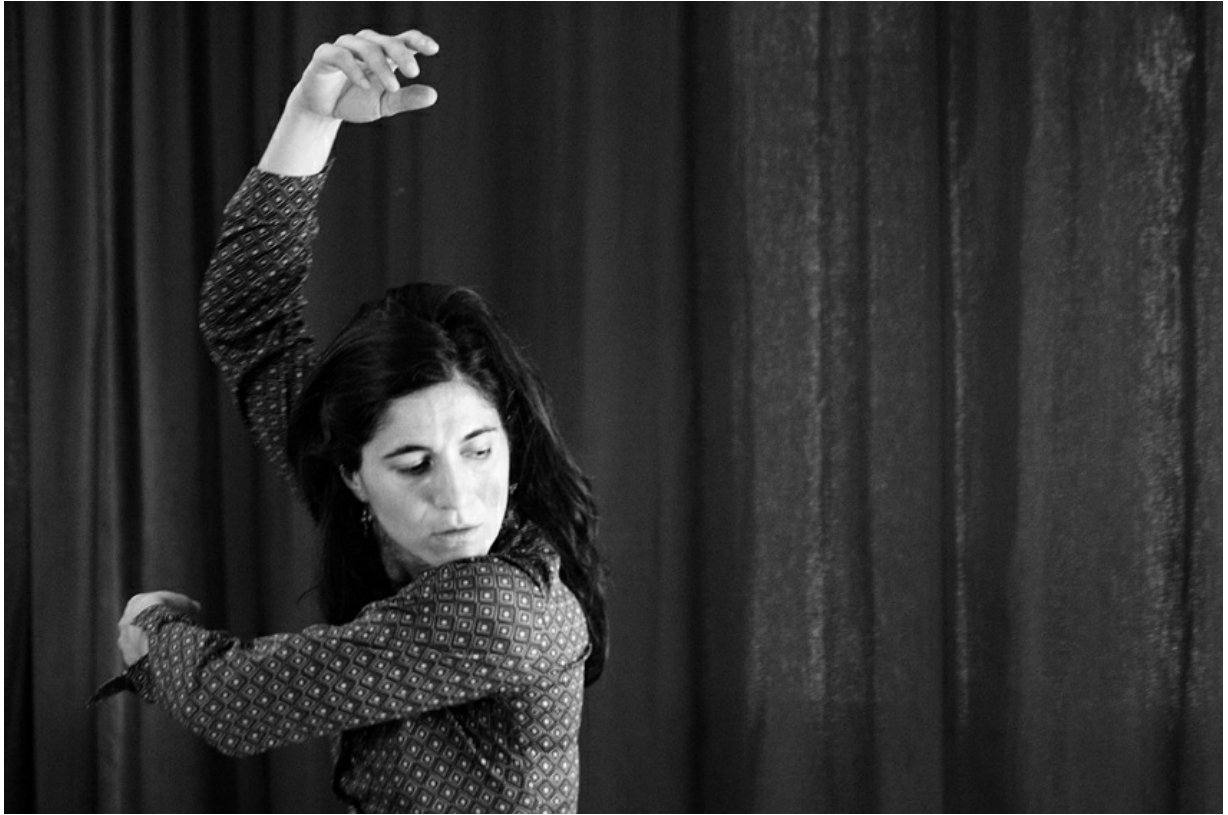
La incorruptible belleza de la distancia, 2011. Cecilia Colacrai Photo. Hernán Galbiati