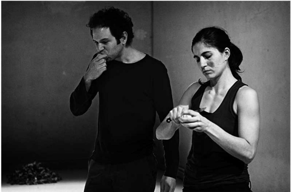
Azul como uma laranja La caldera