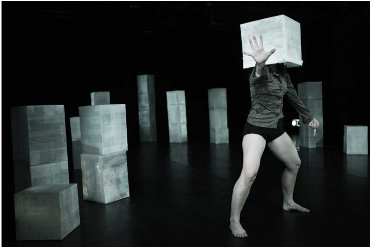
La incorruptible belleza de la distancia. PanoraMix #1, 2012. Cecilia Colacrai