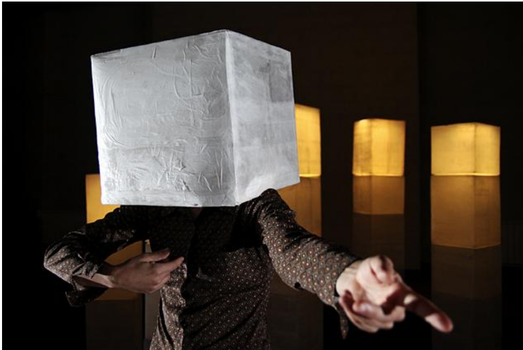
La incorruptible belleza de la distancia, 2012.