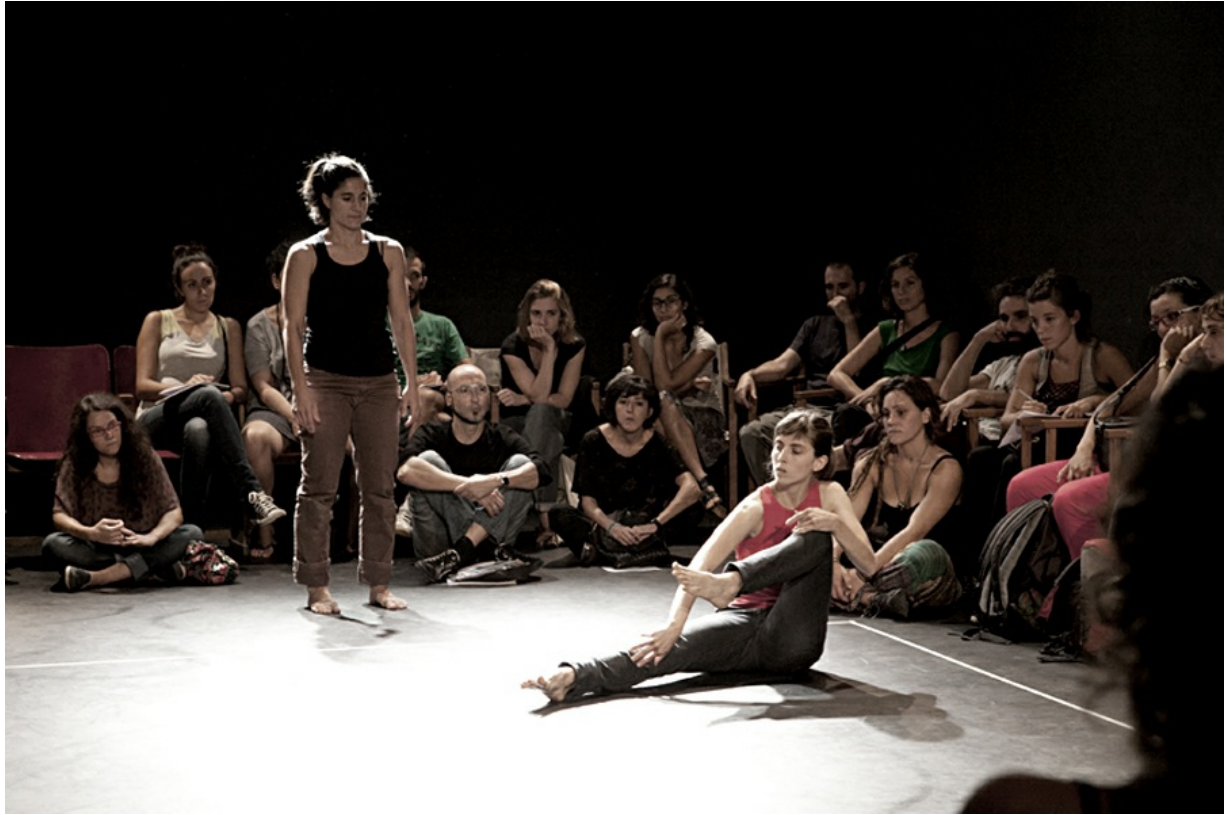
Escena criminal, 2013 Cecilia Colacrai, Mireia de Querol