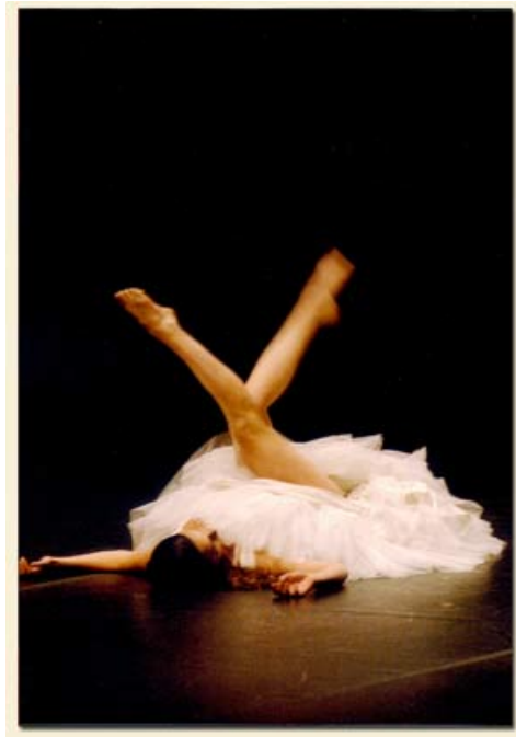
Peixos a les Butxaques. (2003) Dirigitó por Carles Mallol