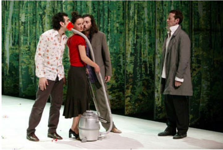
El Jardí Inexistent. (2004) Dirigitó por Carles Mallol