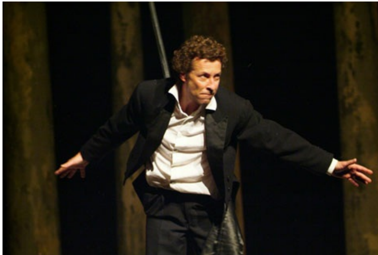
L'home que no tocava de peus a terra (2005). Dirigitó por Carles Mallol